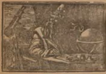
HIJ IS VERSCHENEN

Sinte-Lutgardis' Drukkerij, Jos. Leenen.