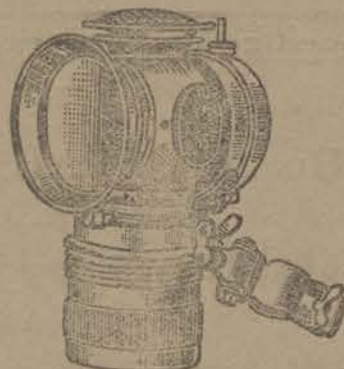
Een jaar gewaarborgd

is tegenwoordig onmisbaar op elk rijwiel. Het is even gevaarlijk — of gevaarlijker — een slecht licht als slechte remmen te hebben. Vermijdt dus alle gevaar en onrust, en plaatst op uw rijwiel eene SOLAR , de uitstekende lantaarn, welke eene prachtige lichtstraal op 50 meters verspreidt. Zij is voorzien van eene algemeene lantaarnhouder, brandt zes uren, en hare vlam wordt automatisch geregeld. De SOLAR , gansch uit koper en met de meeste zorg vervaardigd, vereenigt in zich alle verbeteringen, noodig tot een regelmatig branden en een gebruik van verscheidene jaren.