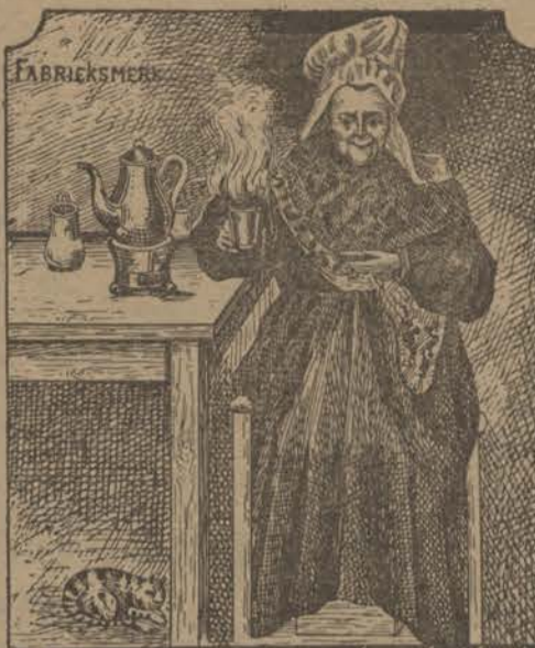
Tot mijn 101 jaar dromt ik de Seeh Gl. de Beukelaar

— Van zijn veertiende jaar af was hij de grootste stooper uit den omtrek! De kapitein maakte dat hij weg kwam.