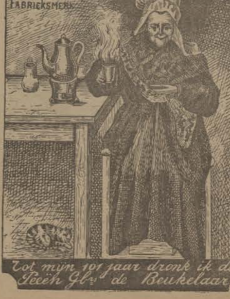
Wat mijn 101 jaar drink ik de Sech' Gl' de Boukelaar