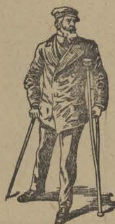
Ik ben in dienst der douanen, waardoor ik dag en nacht blootgesteld ben aan weer en wind en alle temperaturen.