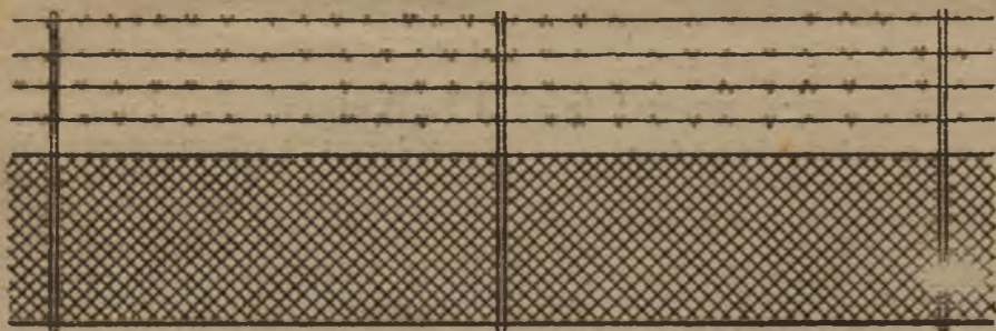
AFSLUITINGEN voor hoven en weiden.

Fabrikanten in Gevlochten IJzerdraad, Diesterstraat, 36, Sint-Truiden.