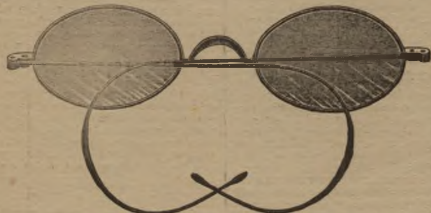
— Wetenschappelijke Optica —

Brillen voor bijzienden en verrezienden. — Blauwe Brillen. — Brillen zonder oogrand. — Pince-nez met volmaakt middenpunt. — Spiraal-pince-nez die op elken neus vaststaan — Hoekige Pince-nez die nooit afvallen. — Brillen met periscopische glazen.