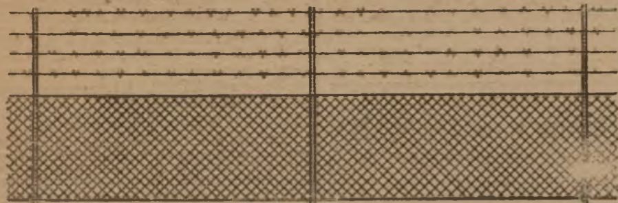
AFSLUITINGEN voor hoven en weiden.

Jos. HEEREN & Zonen Fabrikanten in Gevlochten IJzerdraad, Diesterstraat, 36, Sint-Truiden.