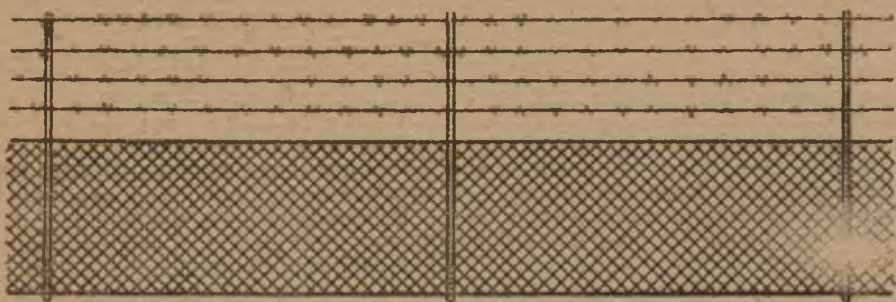
AFSLUITINGEN voor hoven en weiden.