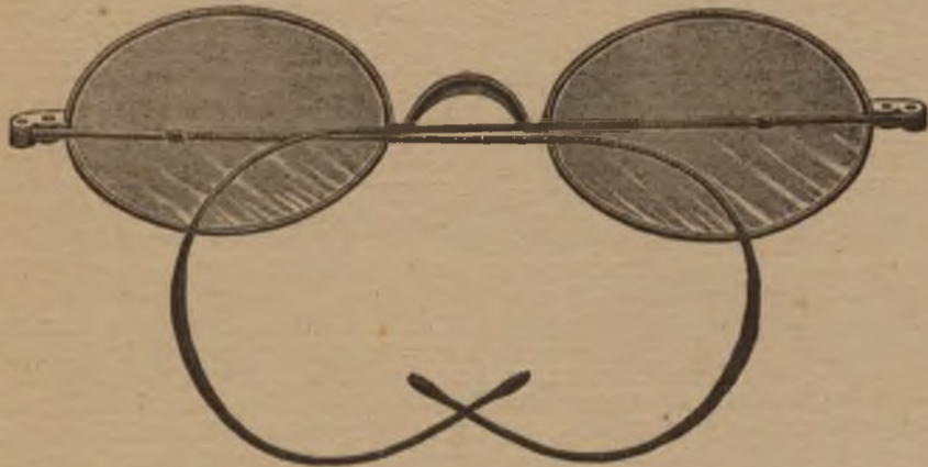
— Wetenschappelijke Optica —

Brillen voor bijzienden en verrezienden. — Blauwe Brillen. — Brillen zonder oogrand. — Pince-nez met volmaakt middenpunt. — Spiraalpince-nez die op elken neus vaststaan — Hoekig Pince-nez die nooit afvallen. — Brillen met periscopische glazen.