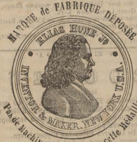
Patte Machine véritable sans cette Médaille.

GROS ET DÉTAIL. BRUXELLES, RUE NEUVE, 105.